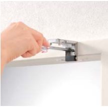
窓枠の外側に取り付ける場合 (正面付け)