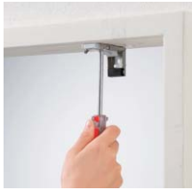
窓枠の内側に取り付ける場合 (天井付け)