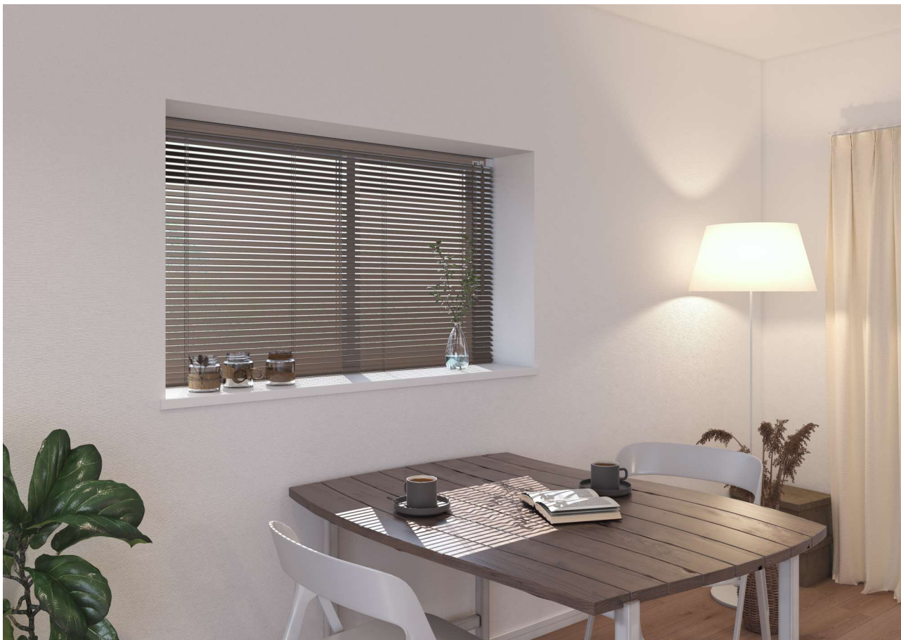
腰高窓：TW-4512 グレージュ

25 mm幅 小窓や小物を飾りたい出窓などにぴったり。コンパクトな設計が魅力です。